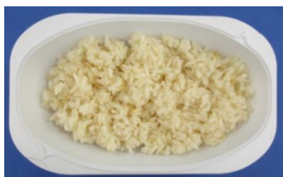
※生姜ご飯(150g)の栄養価