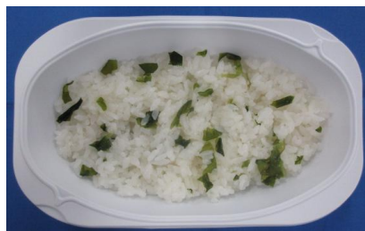
※わかめご飯(150g)の栄養価