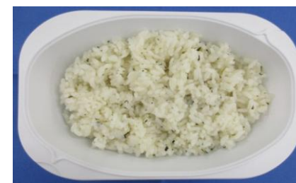
※青菜ご飯(150g)の栄養価