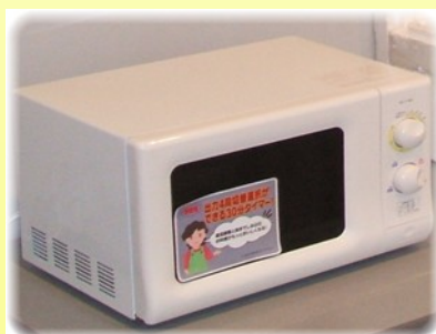
電子レンジで温め