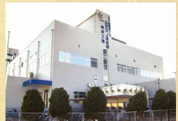
武蔵野フーズ所沢工場