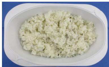
※青菜ご飯(150g)の栄養価