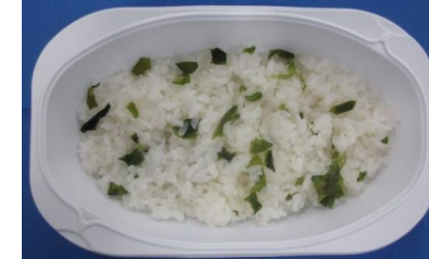
※わかめご飯(150g)の栄養価