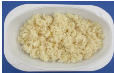
※生姜ご飯(150g)の栄養価